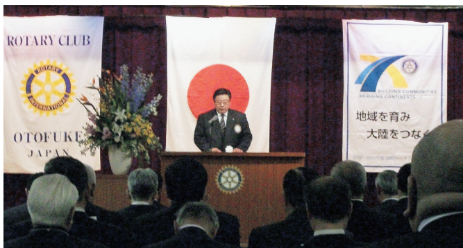
主催者(畠山ガバナー補佐)挨拶