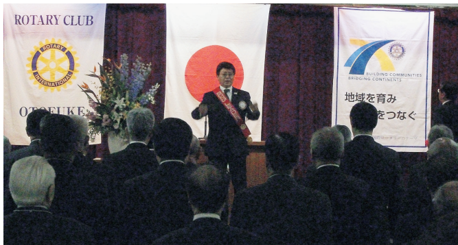
ロータリーソング「奉仕の理想」