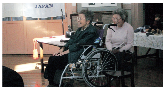
白田園長よりご挨拶